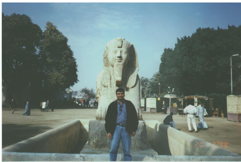
Esfinge de Hatshepsut, que foi a única mulher a reinar no Egito. Ela coroou-se a si mesma como Farani.

Outro acontecimento que atesta o quanto Hatshepsut era mística relaciona-se com a expedição que ela organizou para o país de Pount, que com toda certeza correspondia à Somália. Como confirmam os textos e ilustrações relativos a essa expedição, seu único objetivo era trazer daquele país as árvores de incenso, a propósito do que ela mandou gravar em uma estela que "esse era o alimento preferido dos deuses". O que dizer então da dedicatória que ela mandou esculpir no Speos Artemidos, templo que foi escavado em seu reinado nas falésias orientais do Médio Egito, nas margens do Nilo? Eis a dedicatória: "Minha consciência divina é orientada para o futuro, e meu coração está voltado para a eternidade. Eu glorifiquei Maat, pois Deus a aprecia e sei que ela vive Nele. Ela é o pão que gostou de comer e com o qual formo um só corpo". Você há de convir que essas palavras traduzem um elevado grau de espiritualidade e uma preocupação constante em servir à Divindade. Quando Hatshepsut faleceu, Tutmés III tinha 33 anos. Ele passou a governar sozinho e, como veremos na próxima monografia, trouxe grande brilho para o Egito, tanto no plano exterior quanto interior. Ele também foi um místico de alto nível.